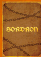
CARTE INGRÉDIENT (VERSO)