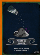
CARTE INGRÉDIENT (RECTO)