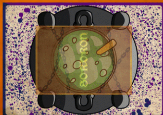
CARTE RECETTE (VERSO "CHAUDRON")