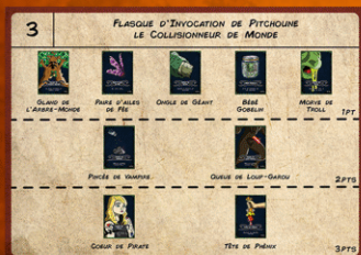
CARTE RECETTE (RECTO)